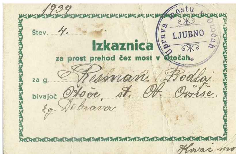
Izkaznica za prost prehod čez most v Otočah, 1939