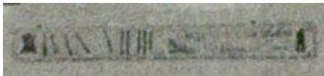
Tabla čevljarkega mojstra – Ivana Vidica, ok. 1900