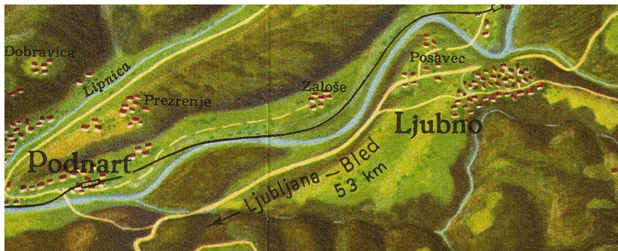
Pozicija Ljubnega, 1954